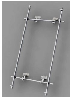
Aufständerung für Satteldach 1 Kollektor