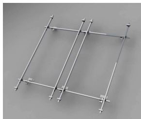
Aufständerung für Satteldach 2 Kollektoren